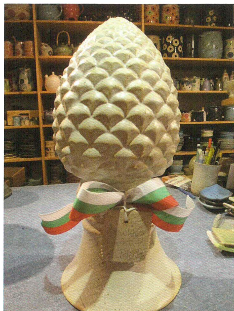
So werden die Augsburger Siegetrophäen aussehen! Alles Unikate!

Jede Trophäe ist ein handgemachtes Unikat aus einer Töpferei in der Augsburger Altstadt!