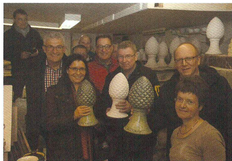
Bei der DFSH-Sitzung in Augsburg überzeugte sich der DFSH-Vorstand von der Idee der originellen Pokale.

Im Jahr 1467 wurde in Augsburg ein römischer Grabbau entdeckt, an dessen Spitze die Zirbelnuss als Verzierung diente. Die Zirbelnuss als Augsburger Symbol begegnet uns im ganzen Stadtgebiet. Das Stadtwappen, viele historische Bauten der Altstadt, Kanaldeckel und die Giebelspitze des Rathauses, das um 1620 von Elias Holl erbaut wurde, ziert das Zeichen der Unsterblichkeit.